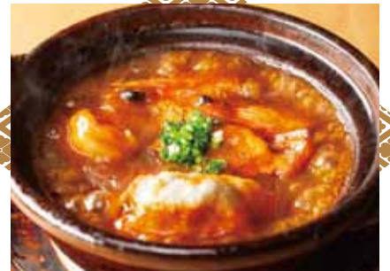
海老真丈と車海老のオマール海老ソース掛