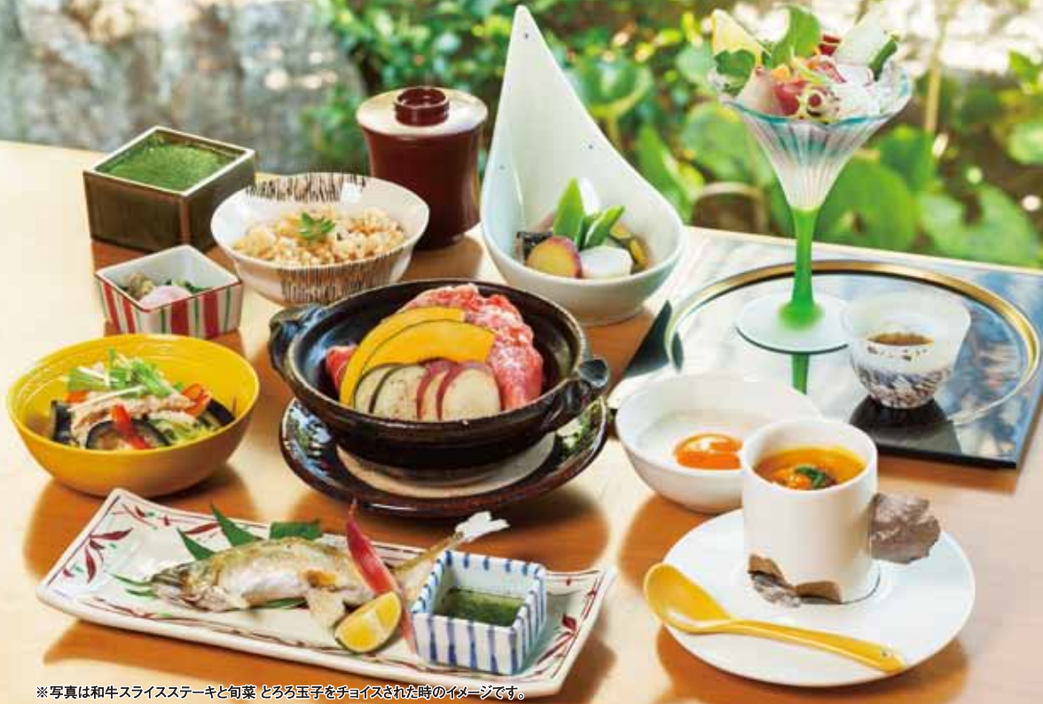
※写真は和牛スライスステーキと旬菜 とろろ玉子をチョイスされた時のイメージです。