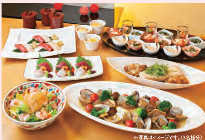
※写真はイメージです。(3名様分)

*前日までのご予約をお願いいたします。(2名様より) *お料理内容等詳細はお問い合わせください。